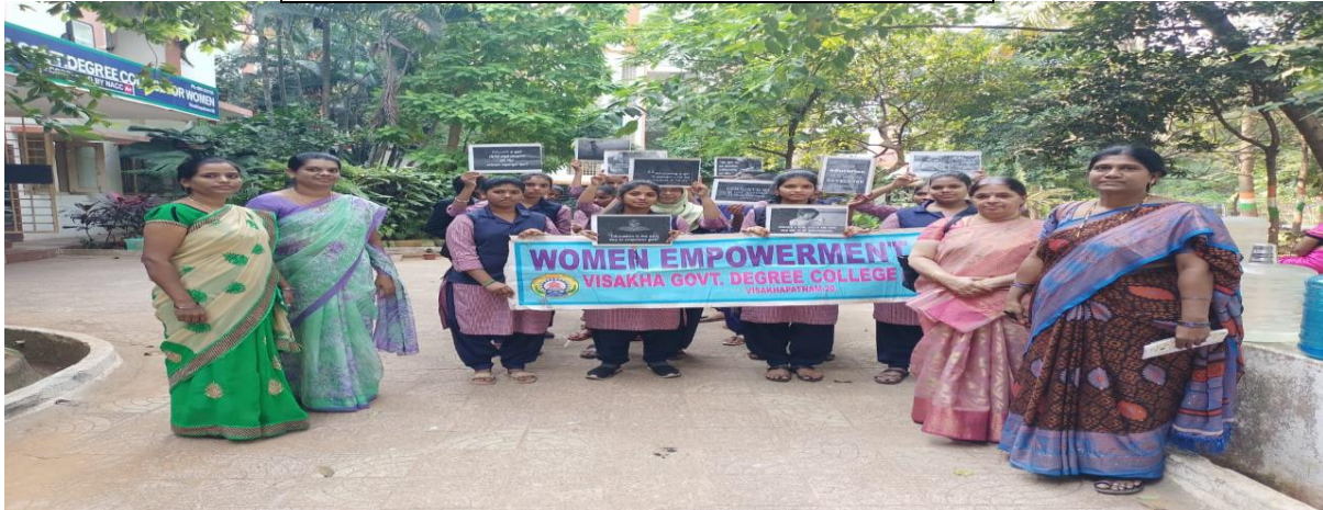
Rally on awareness against child marriages and gender discrimination